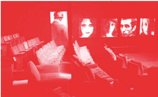
Le Gran Lux DK