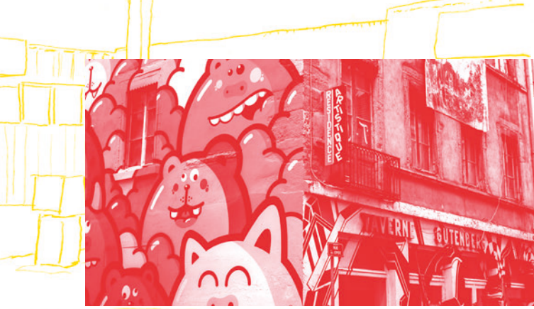
La Taverne Gutenberg DK