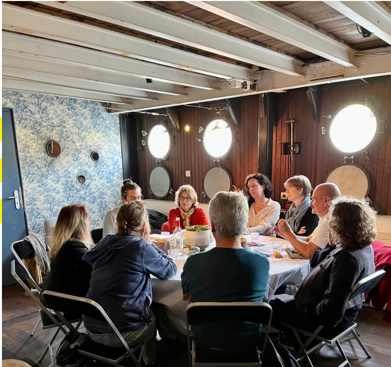
Le jury du Prix Vendredi en pleine délibération lors de l'édition 2022

Cette année, le jury du Prix Vendredi est composé de :