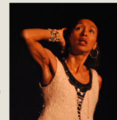
Chapeau de Beurre@Guy Chenu

pour les enfants à partir de 3 ans, au gîte de l'Oustal de la Fontaine Cécile Bergame monte la Cie À Corps Bouillon en 2013 où elle prête sa voix chaude et sucrée à des récits de tradition orale. Elle crée avec le terreau de l'enfance dont elle ne cesse de visiter les souvenirs et les impressions. Elle a, à son actif, une dizaine de spectacles, dont Chapeau de beurre et soulier de verre . Histoires improbables et renversantes, Cécile Bergame nous entraîne dans un tourbillon sensible et savoureux où tension entre poétique et fiction nous plonge au cœur de tous les possibles.