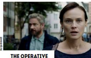
No. la Bninet

Organisés en partenariat avec le Cinéma Le Moulin du Roc, les Cinés polar proposent un cycle de films/débats sur l'espionnage d'octobre 2019 à janvier 2020. À chaque soirée, un film marquant à découvrir et un débat avec un auteur de polar.