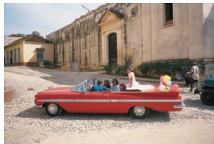
«Cuba», Michel Bouvet

Exposées et récompensées dans le monde entier, ses affiches sont conservées dans les collections permanentes de la Bibliothèque Nationale de France, de la Bibliothèque Forney, du Musée des Arts Décoratifs à Paris, de la ggg gallery à Tokyo et du Musée National de Poznan en Pologne. Membre de l'Alliance Graphique Internationale, il est professeur à Penninghen à Paris. Passionné de photographie, il collabore régulièrement, pour ses affiches ou d'autres travaux, avec des photographes professionnels. Régulièrement invité, comme affichiste, à l'étranger pour des expositions, des conférences, des workshops, des master classes ou des jurys internationaux, il met à profit ces voyages pour prendre des photographies argentiques à l'aide d'un Hasselblad XPan panoramique et d'un Konica Hexar 24 x 36. Les photos graphiques en noir et blanc, plus anciennes, prises aux États-Unis, ont été réalisées avec un appareil Nikon Nikkormat 24 x 36.