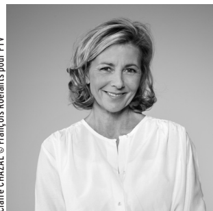
Claire CHAZAL