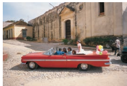
«Cuba», Michel Bouvet

À l'instar d'un road movie imaginaire, une bande-son, aux titres rock soigneusement sélectionnés, accompagne les spectateurs durant la projection des photos argentiques de Michel Bouvet. Régulièrement invité, comme affichiste, à l'étranger pour des expositions, des