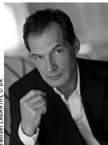
Samuel LABARTHE

En 1952, Nicolas Bouvier avait entrepris un lent voyage vers l'est, en compagnie du peintre Thierry Vernet. Cette déambulation les conduit jusqu'en Afghanistan, avant que Bouvier ne reparte seul vers l'Inde. L'usage du monde réhabilite l'art de voyager, au rebours de tout exotisme et de vulgaire voyage touristique, le voyage de Bouvier est moins une fuite qu'une « philosophie de la libre dérive ».