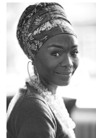
Valérie BELINGA © Audrey Bonnet

«Bakhita» de Véronique Olmi © Albin Michel, 2017