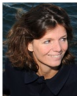
Maylis de Kerangal