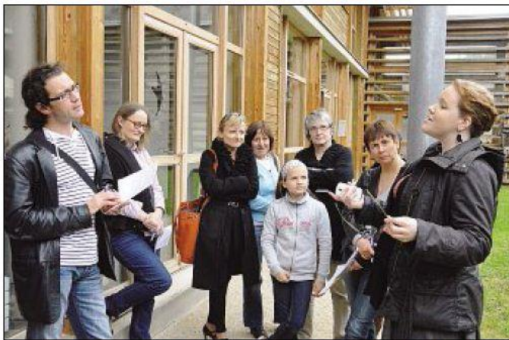
ENQUÊTE. Une cinquantaine de participants a pris part au jeu organisé par l'Amiral Flottant.

Comme chaque année, une après-midi de clôture était organisée pour célébrer les résultats du prix littéraire adulte de l'ABLF. Le grand public, composé en grande majorité de lecteurs, était invité à participer à un jeu d'enquête organisé par l'association