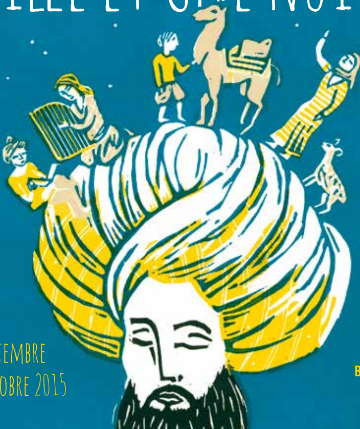
ILLUSTRATION: JULIA CHAUSSON