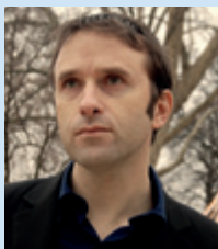
Jérôme Attal