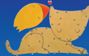
Malika Doray - Un bisou pour...

"Les petits cœurs en ribambelle" vibrent au rythme de leurs émotions, entre tendresse et câlin, grosse colère et chagrin. Avec les ateliers de création de livres de Malika Doray, le coloriage géant de Lucie Vandevelde, les spectacles "Pop up" du Collectif Extra Muros et les "Racontines de Monique et Katia", une tonnelle aux histoires, des jeux... et, même, en avant-première du salon, "La Rentrée du Petit Lecteur" dans les Quartiers Sud du Mans du 1 au 11 octobre.