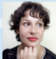
Alice Zeniter