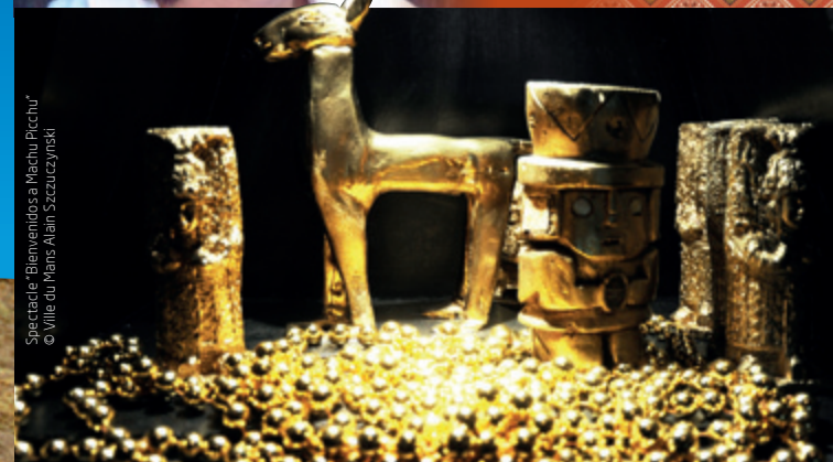
Spectacle "Bienvenidos a Machu Picchu"