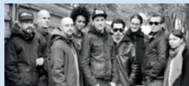
Soma productions © Christophe Oudini

la littérature s'imprègne des cultures urbaines. Les jeunes d'ateliers rap, slam, lecture à voix haute... mêlent leur voix à celles de l'auteur et chanteur issu du rap Kaar Kaas Sonn, du collectif Soma productions autour de sa création de spectacle inspirée du Meilleur des mondes d'Aldous Huxley et des artistes du livre Certifié(e)s Hip Hop .