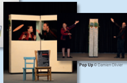
Pop Up