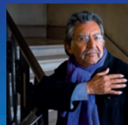
Angel Parra