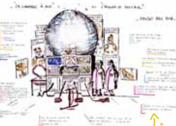
« Atelier de Voltair »