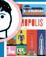
MÉTROPOLIS éd. Actes Sud junior