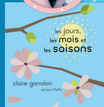
LES JOURS, LES MOIS ET LES SAISONS éd. Mémé