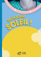
BONJOUR SOLEIL ! éd. Thierry Magnier