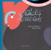
MES IDÉES FOLLES éd. Le Port a Jauni