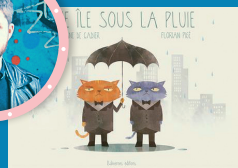
UNE ÎLE SOUS LA PLUIE éd. Balivernes